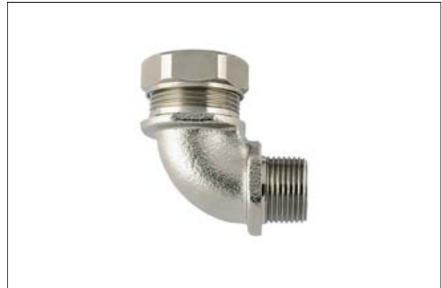
HelaGuard PSRSC-90FMCSS 90°-Kompressionsverschraubung.