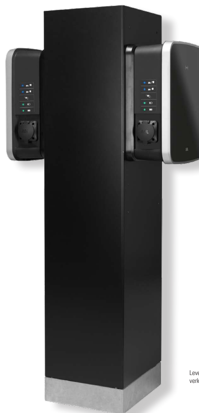
Levering zonder apart verkrijgbare Wallboxen eMH3

De zuil POLEMH6 wordt gebruikt voor de montage van een of twee Wallboxen eMH3 ABL. De POLEMH6 overtuigt door zijn aantrekkelijke en compacte metalen behuizing met sluitcilinder voor gecontroleerde toegang tot de ingebouwde apparatuur. Er kan een Wallbox eMH3 aan de voorzijde, en een tweede Wallbox eMH3 aan de achterzijde worden gemonteerd, deze kan via de interne kleine verdeelkast worden aangesloten. Bovendien biedt de verdeler voldoende ruimte voor de montage en aansluiting van een externe besturingseenheid 1V0002. Het WPR36 beschuttingsdak en de CABHOLD laadkabelhouder zijn qua kleur op de zuil afgestemd (RAL 9011) zodat harmoniëren met het laadpunt. Klinkmoeren zijn standaard gezet en afgedekt met blindstoppen, zodat achteraf boren niet nodig is. Voor een stabiele plaatsing adviseert ABL om de zuil op het optioneel verkrijgbare betonfundament EMH9996 te monteren.