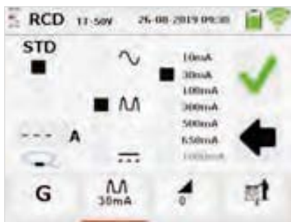
Auswahlmenü RCD Messung Typ A, AC, B, F