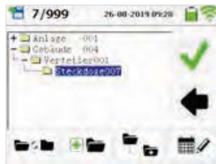
Speichermenü Speicherung in 3 Ebenen