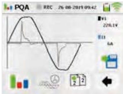
Netzanalyse Scopefunktion Spannung und Strom