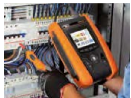
GSC60 mit externer Prüfsonde PR400

* mit optionaler Sonde HT52/HT53 ** mit optionaler Stromzange HT96U