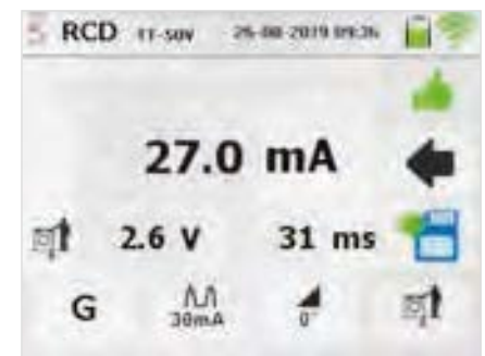
RCD Messung Ergebnis Auslösezeit ta Auslösestrom Ia und UB

Abgebildete Mobilgeräte gehören nicht zum Lieferumfang.