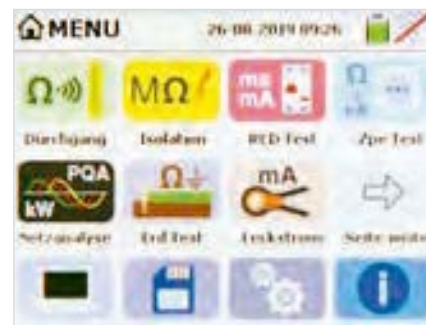
Hauptmenü Auswahl aller Messfunktionen

Über den Touchscreen können Sie einfach und intuitiv die gewünschte Energie-Messung auswählen. Nehmen Sie die gewünschten Einstellungen im geführten Menü vor und drücken Sie GO. HTOS™ hilft Ihnen die richtigen Messungen durchzuführen. Das Display zeigt OK (thumbs up) oder NOT OK (thumbs down), ein Hilfemenü unterstützt Sie während der gesamten Zeit.