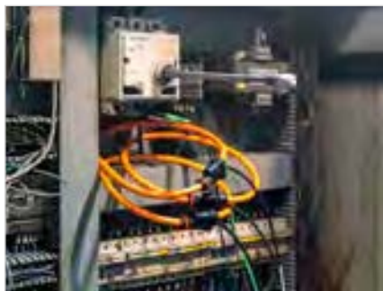
Messung Einsatz der flexiblen Stromwandler