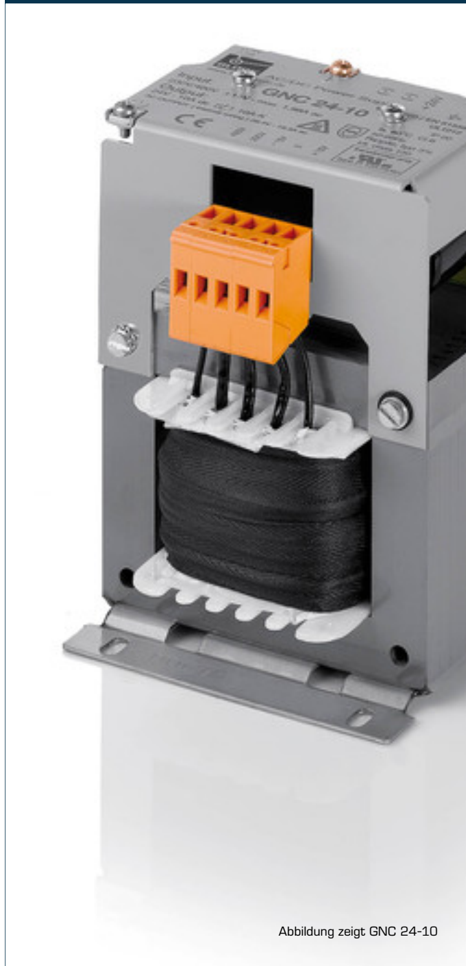
Abbildung zeigt GNC 24-10