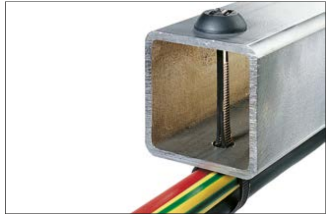
Einfache Montage durch beidseitige Verzahnung des BHT375.