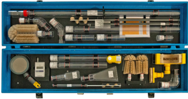
Set – Bestückung TRS MS V1: