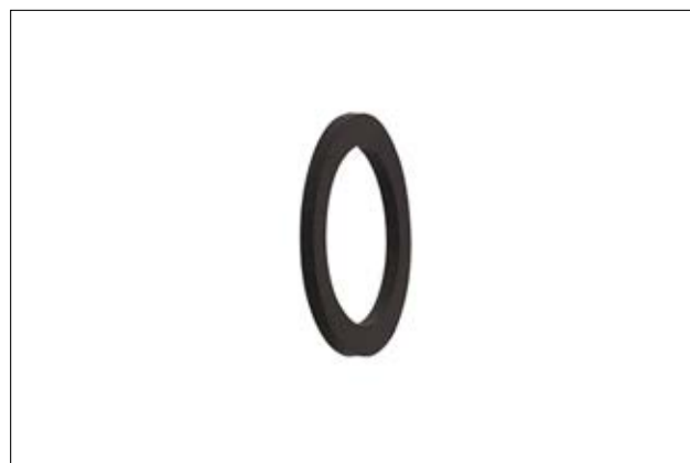
HelaGuard AWS Chloropren-Dichtungsscheibe.