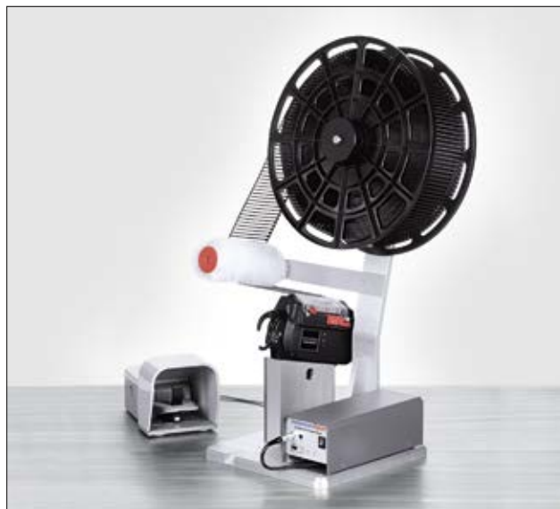
Montagevorrichtung CPK mit Fußschalter (auch zu sehen: Autotool 2000 CPK, Netzgerät CPK und T18RA3500).