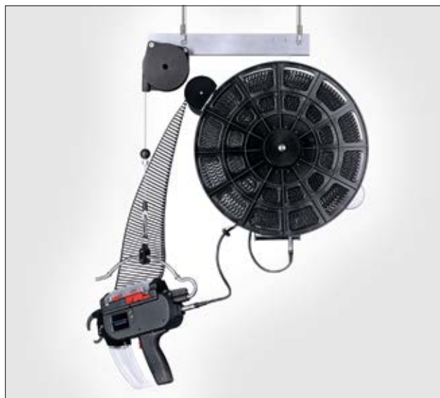
Hängevorrichtung CPK (auch zu sehen: Autotool 2000 CPK, Netzgerät CPK und T18RA3500).