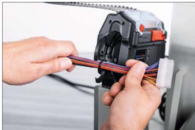
Anwendungsbeispiel mit der Montagevorrichtung CPK.