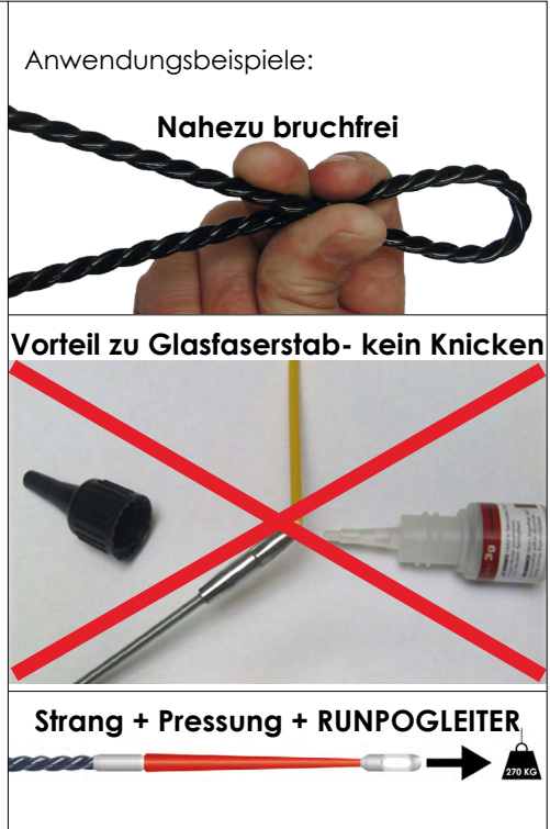
Beschreibung Profi Set Ø 4,5 mm siehe Seite 2