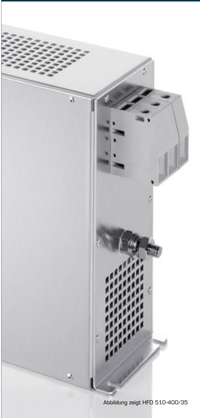
Abbildung zeigt HFD 510-400/35