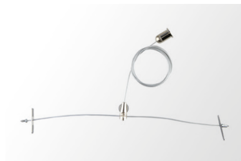
Stahlseilabhangung für LED Panel VEKT