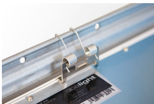
SNAP-IN FIO OWAtecta (S22)