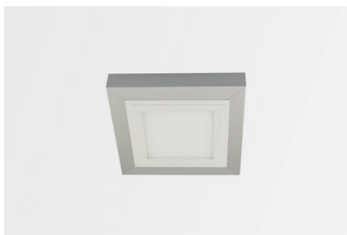
Aufbau-Montagerahmen für LED Panel SNAP 198 x 198, silber matt