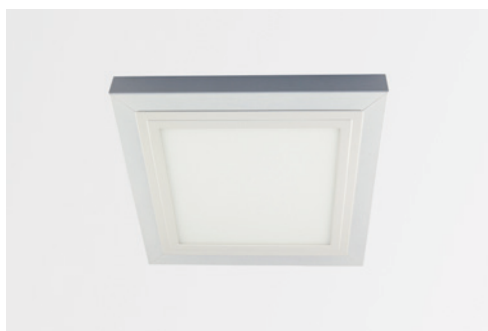
Aufbau-Montagerahmen für LED Panel SNAP 318 x 318, weiss