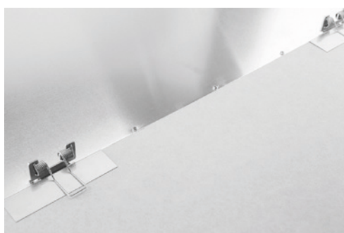
GK-Montage mit SNAP-IN Federeinbausatz