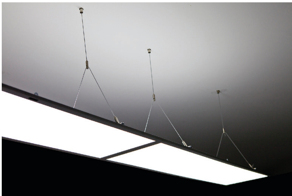
Stahlseilabhangung für LED Panel VEKT