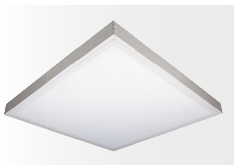
Aufbau-Montagerahmen für LED Panel STEP II, weiß