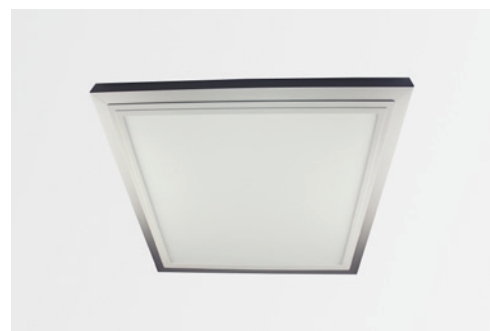
Aufbau-Montagerahmen für LED Panel SNAP 618 x 618, silber matt