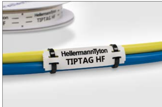
TIPTAG HF – bedruckbare Kennzeichnungsschilder.