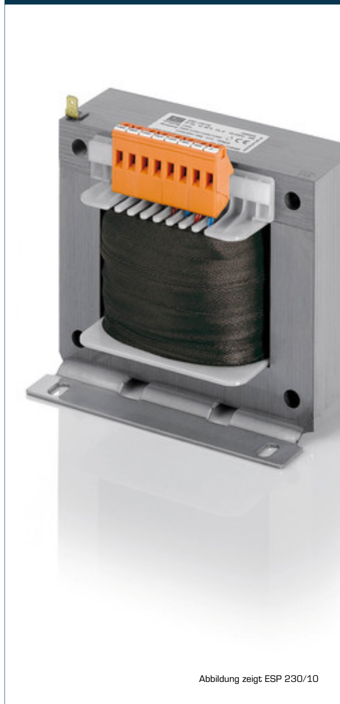
Abbildung zeigt ESP 230/10