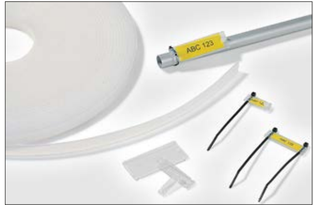
Vielseitig einsetzbar zur Kennzeichnung: Helafix HC und HCR.