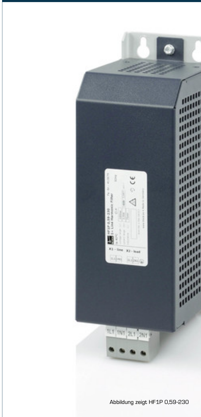
Abbildung zeigt HF1P 0,59-230