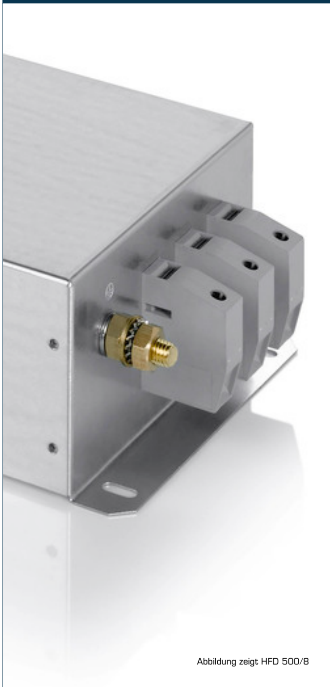
Abbildung zeigt HFD 500/8