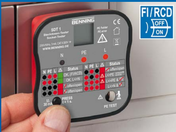
Prüfung der Auslösefunktion eines 30 mA FI/RCD-Schutzschalters durch Betätigung der Prüftaste.