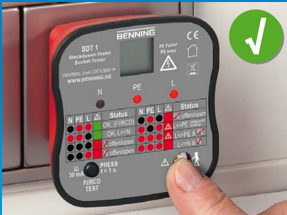
Steckdose korrekt installiert, Fingerkontakt prüft PE-Kontakt auf gefährliche Berührungsspannung.