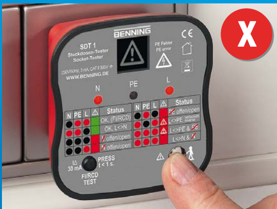
Steckdose mit Verdrahtungsfehler, Lebensgefahr! Außenleiter (L) und Schutzleiter (PE) wurden vertauscht!