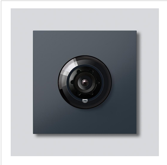
Systemfreie Kamera 180 für Siedle Vario CM 618-02 AG 210004912-01