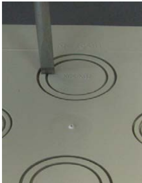
Bild 2: Schraubendreher am Rand korrekt angesetzt / Picture 2: screw driver at the edge: right position

Screwdriver used at the edge, off-center! And away from the nearest possible outbreak hole.