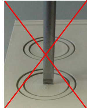
Bild 5: Schraubendreher falsch angesetzt / Picture 5: screw driver in the center: wrong position