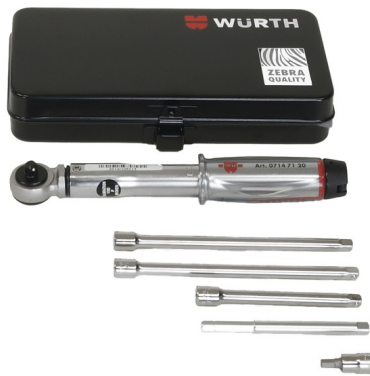
Werkzeugset für HSI 150-DG/HRK SSG