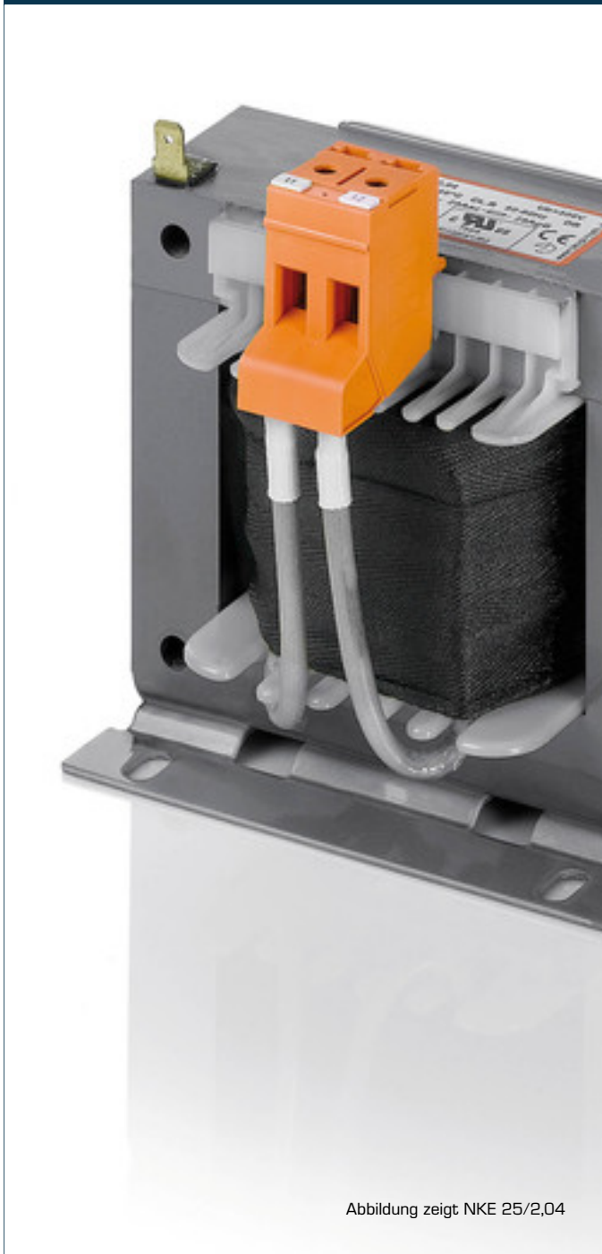
Abbildung zeigt NKE 25/2,04