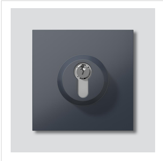
Schloss-Modul SM 611-01 AG 210004992-00