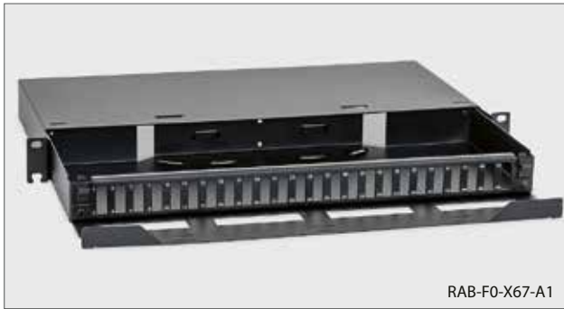
■ RAB-FO-X67-A1, RAC-FO-X67-A1 Ausziehbares 19"-LWL-Gehäuse 1HE 24x SC-D (Die Stecker sind nicht Bestandteil des Beipacks.)