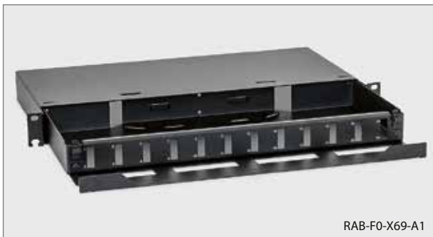
■ RAB-FO-X69-A1, RAC-FO-X69-A1 Ausziehbares 19"-LWL-Gehäuse 1HE 12x SC-D (Die Stecker sind nicht Bestandteil des Beipacks.)