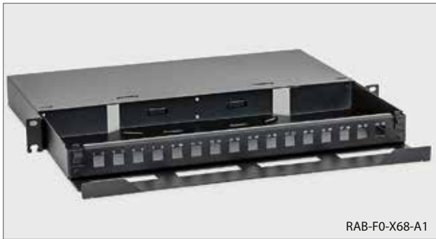
■ RAB-FO-X68-A1, RAC-FO-X68-A1 Ausziehbares 19"-LWL-Gehäuse 1HE16x LC-D - square (Die Stecker sind nicht Bestandteil des Beipacks.)