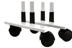
Zubehör: Laufrollen VZ-VF-LR