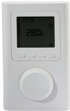
Notwendiges Zubehör: Raumthermostat VTX-SP