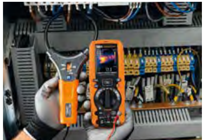
AC Strommessung mit flexiblem Wandler F3000U mit Wärmebildanzeige.