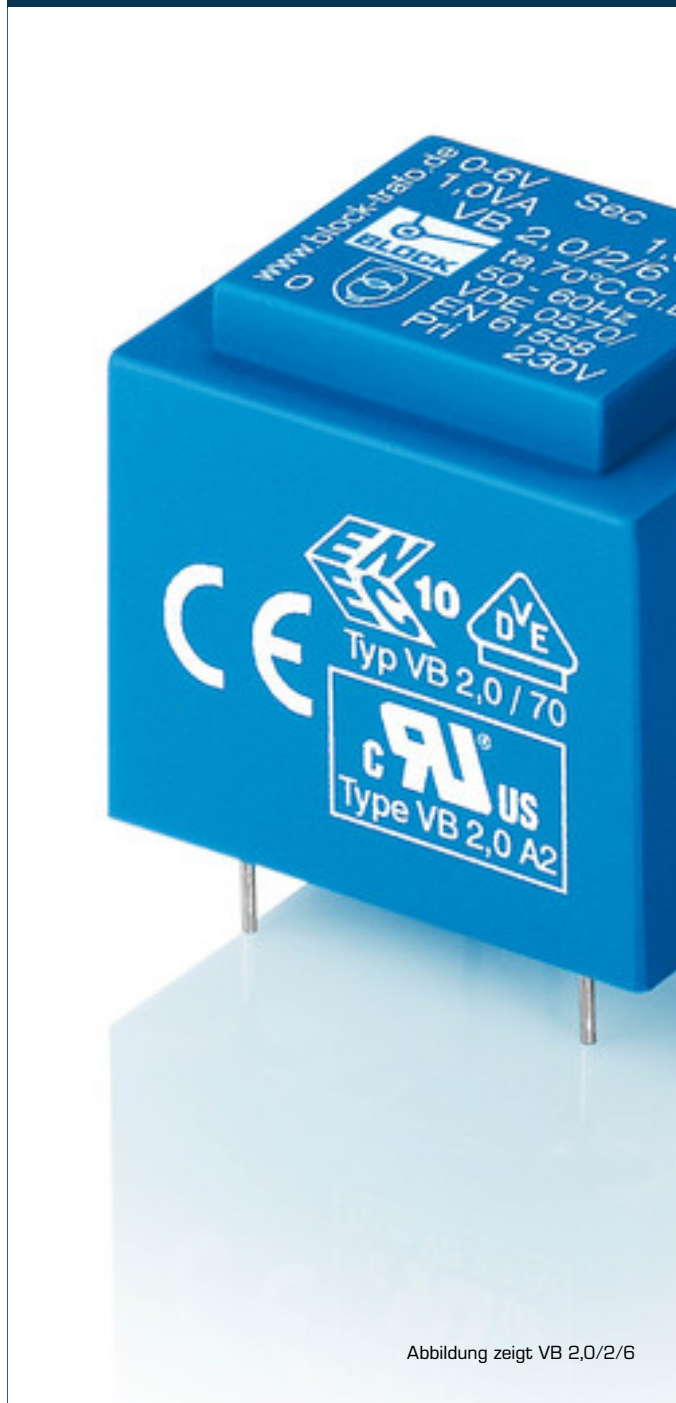
Abbildung zeigt VB 2,0/2/6