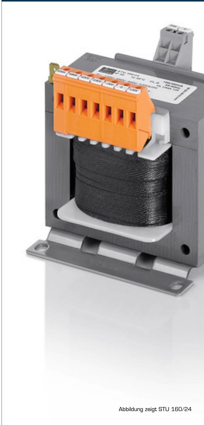
Abbildung zeigt STU 160/24