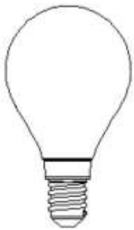
Abmessungsskizze LED LM85133-4

– http://www.lightme.eu/oekodesign/entsorgung/index.html