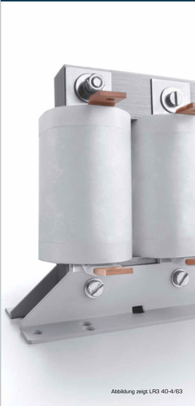
Abbildung zeigt LR3 40-4/63