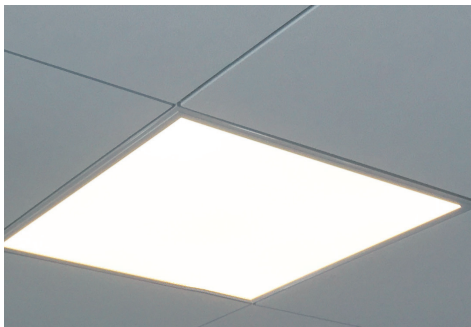
LED Panel VEKT in Kassettendecke