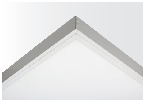
Multi-Rahmen für LED Panel VEKT, weiß