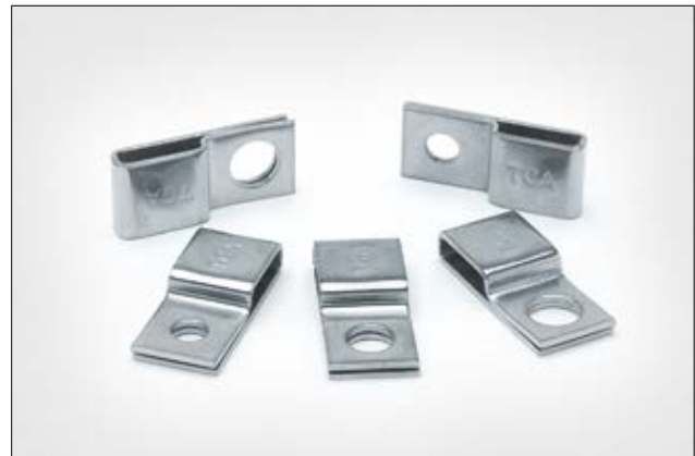
Edelstahlsockel der SSPC-Serie für Anwendungen in rauen Umgebungen.