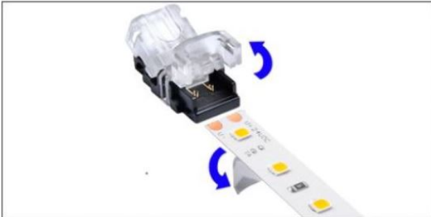
Das Streifenende des Konnektors öffnen und den Anfang der Schutzfolie des Klebebands entfernen