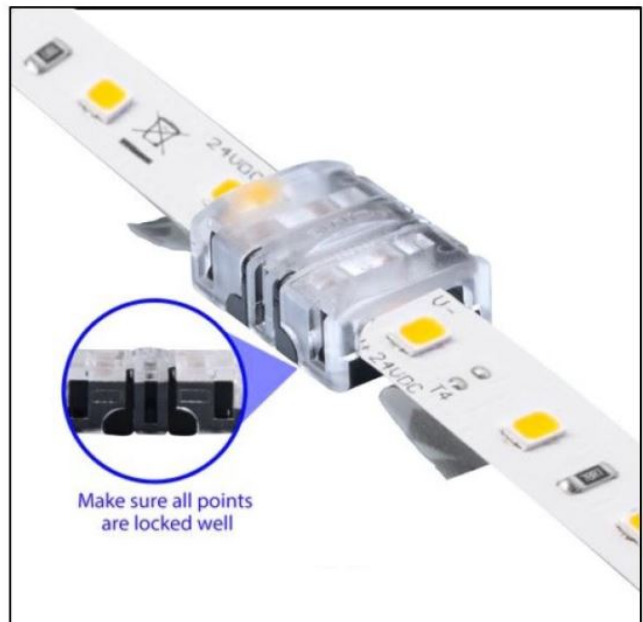
Die seitlichen Haltenasen müssen komplett einrasten