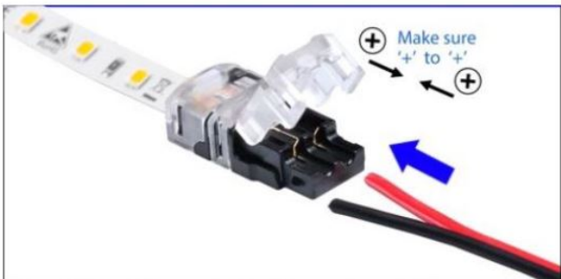
Das LED-Streifenende des Konnektors öffnen und die Anschlussleitung entsprechend der Polung des LED-Bandes einlegen