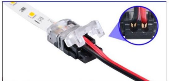
Die Kabellitzen in den Schneidkontakten platzieren