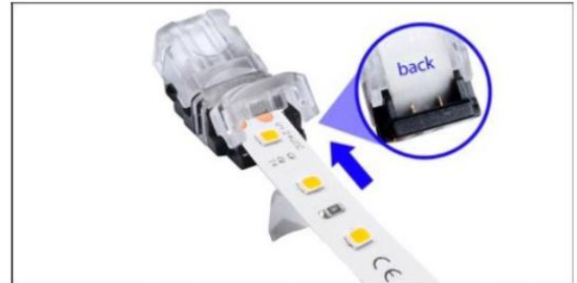
Den LED-Streifen im Konnektor auf den Pins platzieren