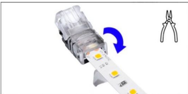
Den Konnektor mit eingelegtem LED-Streifen vorsichtig schließen. (Bei Bedarf eine Zange verwenden)