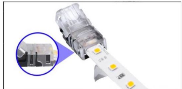
Die seitlichen Haltenasen müssen komplett einrasten