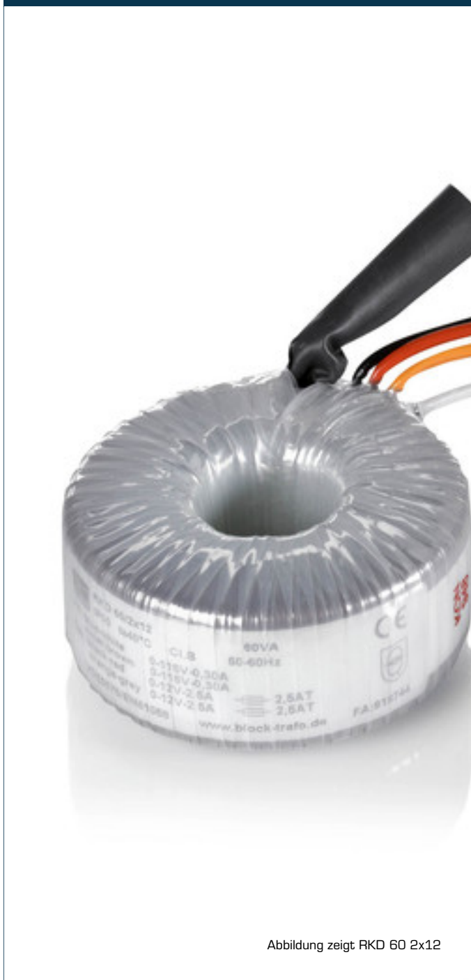
Abbildung zeigt RKD 60 2x12