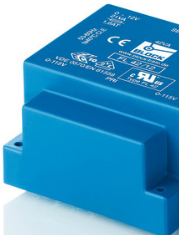
Abbildung zeigt FL 42/12