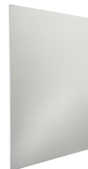
VL-Axxxxx in Weiß