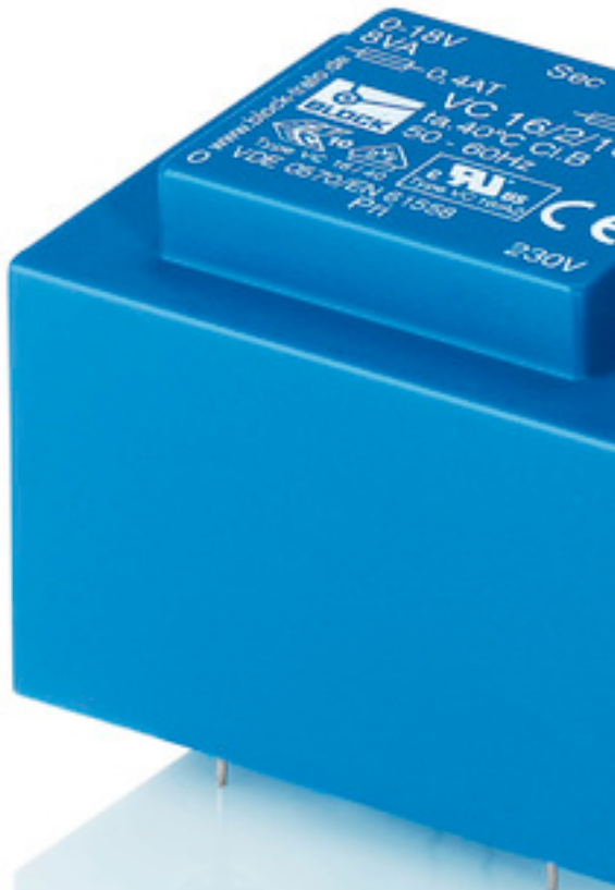
Abbildung zeigt VC 16/2/18