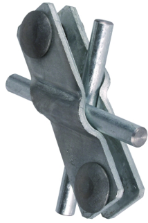
Figures without obligation