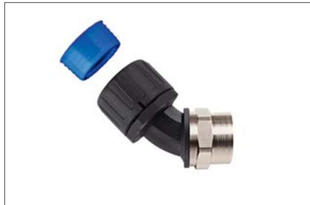
HelaGuard HGL-45F 45°-Verschraubung mit drehendem Messing-Innengewinde inkl. Schlauchdichtung.