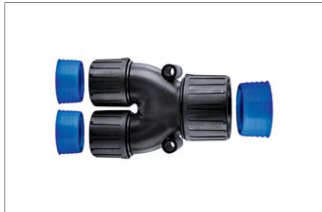
HelaGuard HGL-Y Y-Verteiler mit Schlauchdichtung.