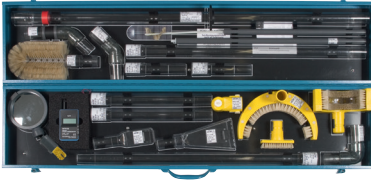
Set – Bestückung TRS MS V1: