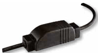
Lighting Slim Receiver RTS