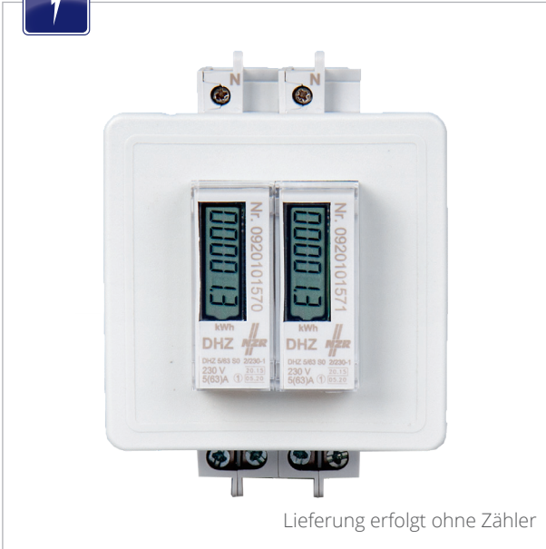
Lieferung erfolgt ohne Zähler