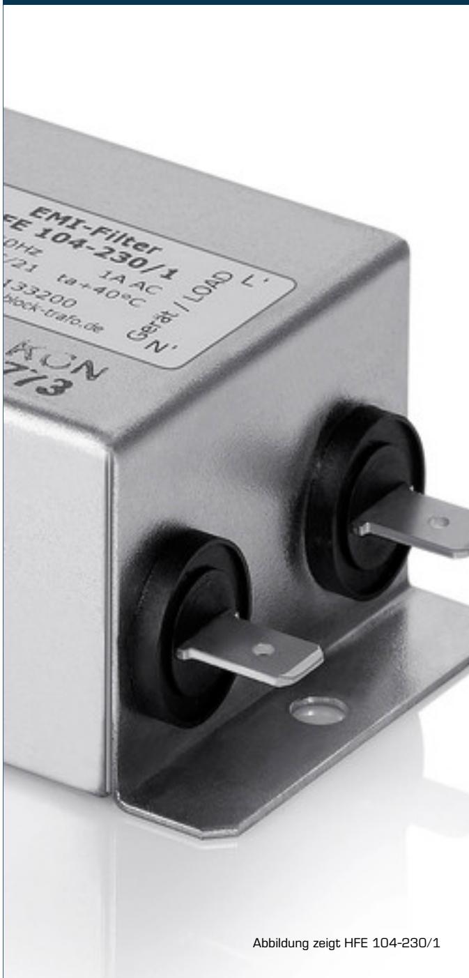
Abbildung zeigt HFE 104-230/1