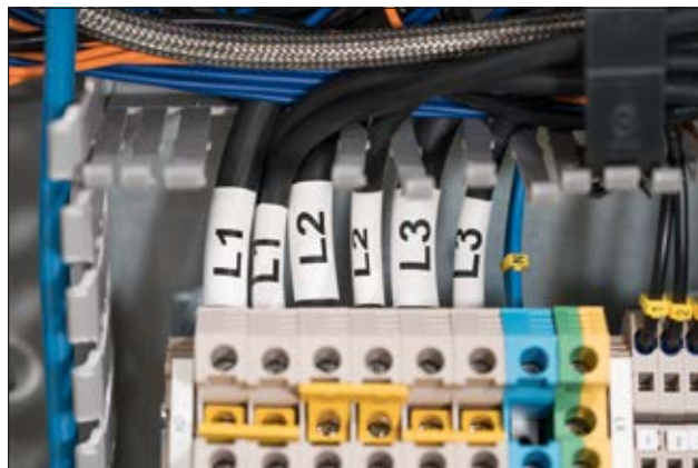
TULT – gute mechanische Festigkeit und Chemikalien- und Lösungsmittelbeständigkeit.