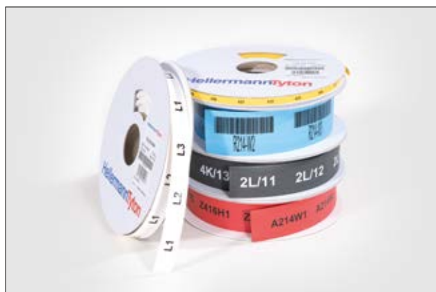
TULT – hochflexible Schrumpfschläuche in fünf Farben und unterschiedlichen Größen.