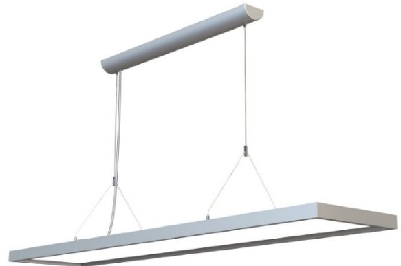
Abb. 1 - LED Büroleuchte KENDO

Alle weiteren technischen Merkmale und Daten bezüglich der LED Büroleuchte KENDO sind dem Leuchten-Datenblatt zu entnehmen und nach Bauabschluss in der Baudokumentation zusammen mit dieser Installations- und Betriebsanleitung zu hinterlegen.