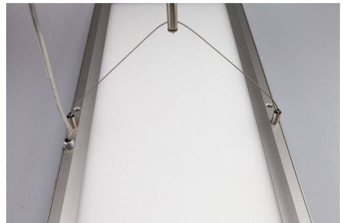
Abb. 3 - Montage Seilsystem