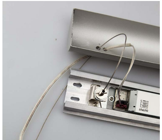
Abb. 5 - Anschluss sekundärseitig

abalight GmbH Daruper Straße 2 D-48727 Billerbeck