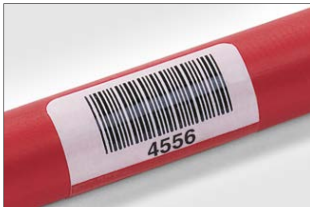
Helatag sorgt für die dauerhafte Kennzeichnung von Kabeln mit Barcodes.