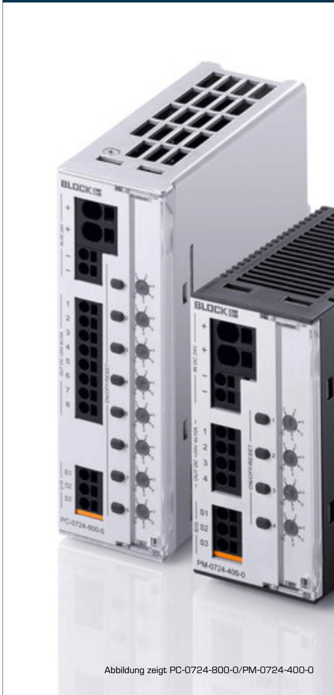
Abbildung zeigt PC-0724-800-0/PM-0724-400-0