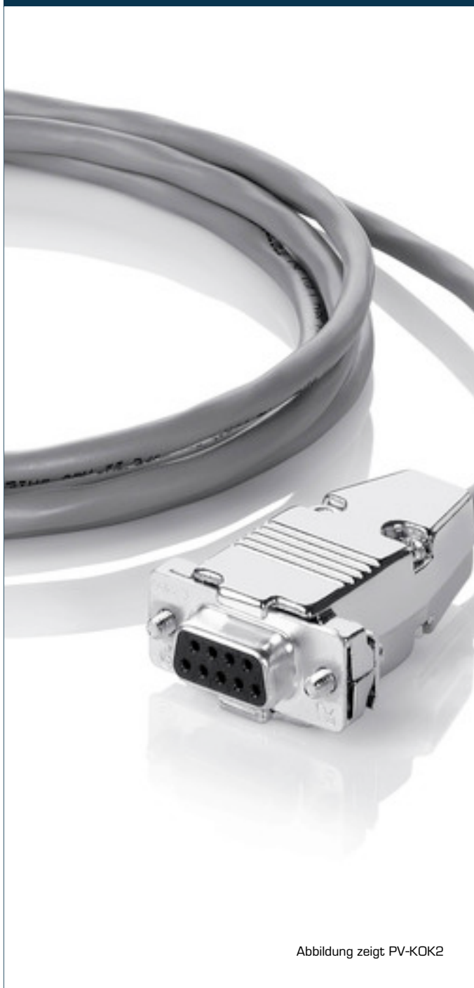
Abbildung zeigt PV-KOK2