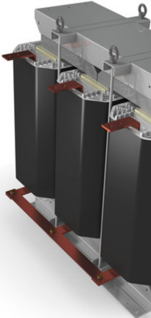
Abbildung zeigt TT3-A630-4040-0