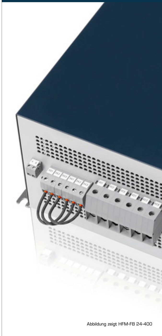
Abbildung zeigt HFM-FB 24-400